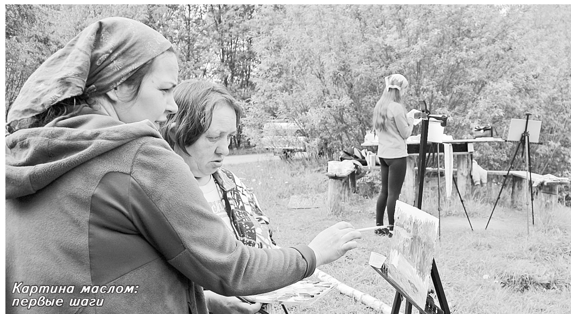
Картина маслом: первые шаги

Проект «Свободный художник» реализуется при финансовой поддержке фонда «Добрый город Петербург».