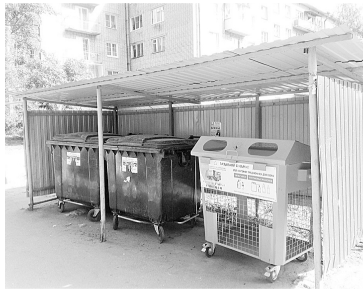
В различных микрорайонах города установлено 20 оранжевых контейнеров для раздельного сбора отходов